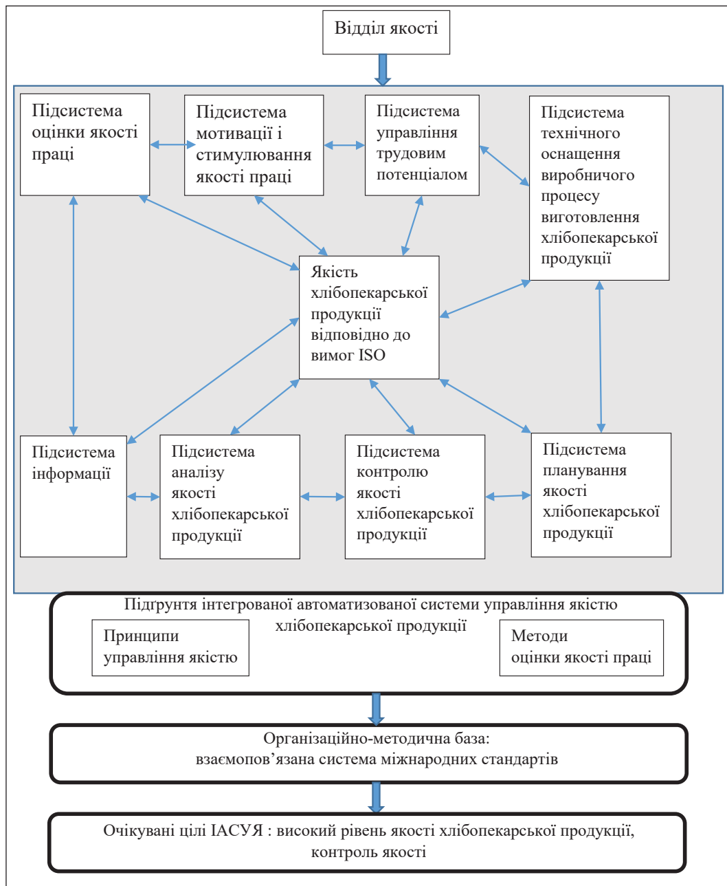
Рис. 2. Інтегрована автоматизована система управління якістю хлібопекарської продукції

Інтегрована автоматизована система управління якістю продукції на хлібокомбінаті є