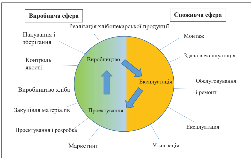
Рис. 1. «Петля якості» – етапи забезпечення якості хлібопекарської продукції

Динамічність вимог до якості на кожній стадії виробництва хлібопекарської продукції зумовлює